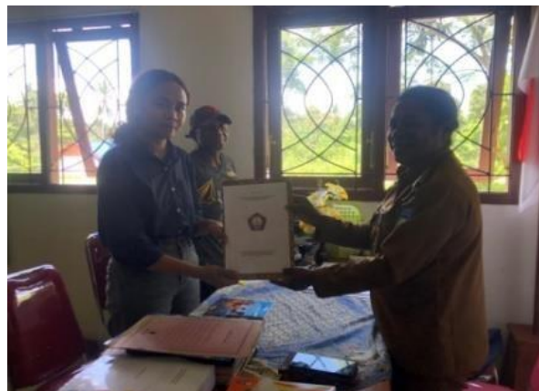
Gambar 4.2 Wawancara Peneliti Terhadap Kepala Distrik Rasiei