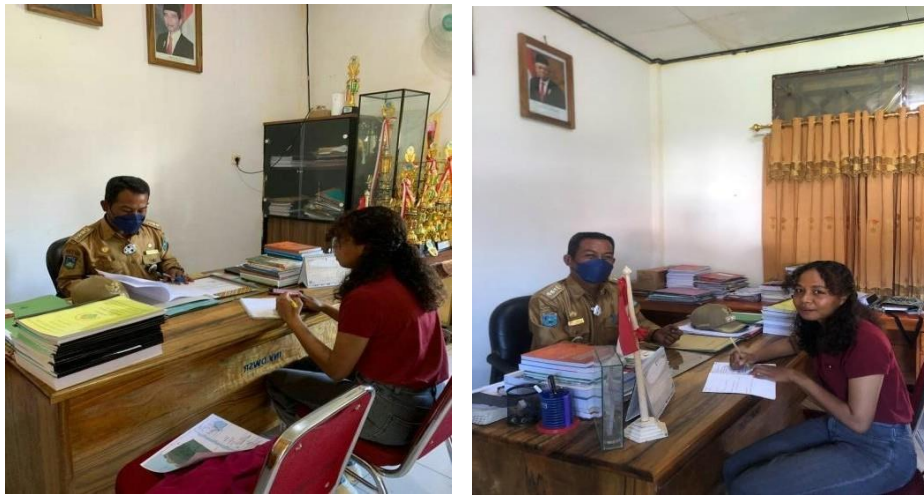
Gambar 4.2 Wawancara Peneliti Terhadap Kepala Distrik Wasior