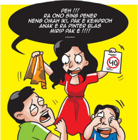
ILUSTR.: AFRIZAL SAIFUL MAHBUB/JP