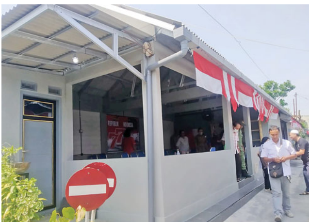
RT 17 RW 07 Kelurahan Ngronggo, Kecamatan Kota Kediri

pertemuan warga. Namun juga jadi lokasi mengecek kesehatan lansia. Pun menggelar pertemuan hari besar, seperti peringatan Agustusan dan halalbihalal. Bahkan, ibu-ibu di RT di sana menggunakan untuk acara arisan. Padahal sebelumnya tempat arisan selalu bergilir dari rumah ke rumah warga. (ndr)