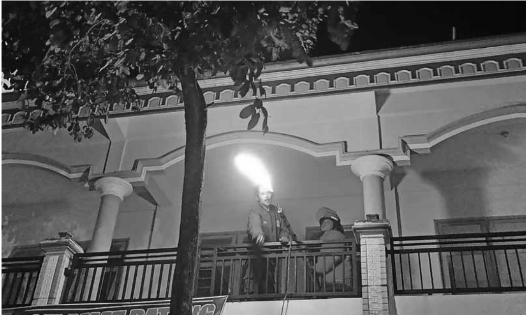
DAMKARMAAT NGANJUK FOR JPRK

lisi. Semua akan dikroscek ke-benarannya. Karena itu, semua saksi akan dipanggil dan dipe-riksa intensif. Barang bukti (BB) juga akan dikumpulkan. "Masih penyelidikan saat ini," pung-kasnya. (wib/tyo)