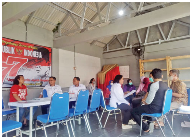
RT 17 RW 07 Kelurahan Ngronggo, Kecamatan Kota Kediri