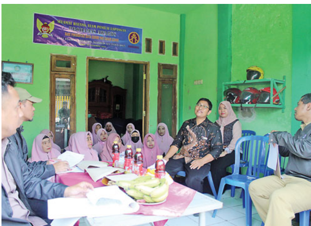
RT 02 RW 02 Kelurahan Ngadirejo, Kecamatan Kota Kediri