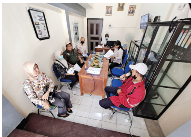
RT 26 RW 09 Kelurahan Tosaren, Kecamatan Pesantren