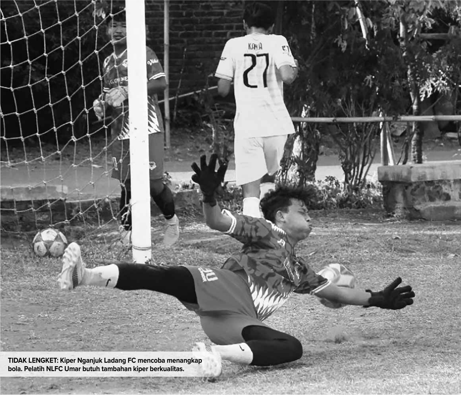
TIDAK LENGKET: Kiper Ngunjuk Ladang FC mencoba menangkap bola. Pelatih NLFC Umar butuh tambahan kiper berkualitas.