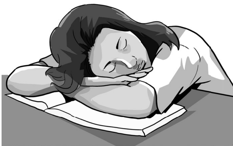
ILUSTRASI: AFRIZAL SAIFUL MAHUB/UPK

Tulis pendapatmu di Student Talk edisi ini. Ada hadiah uang tunai dan souvenir bagi yang beruntung. Selengkapnya baca syarat dan ketentuan. (*)