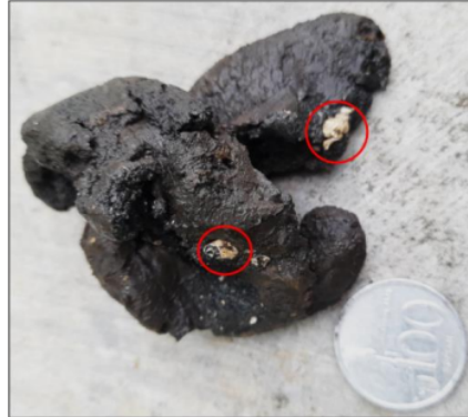
Gambar 3. Endapan lempung dengan campuran pasir halus hasil pada kedalaman 4 m ditandai dengan adanya foraminifera besar yang melimpah

Sampel yang diperoleh dari pemoran dangkal (Gambar 3) dapat identifikasi secara megaskopis sebagai berikut: warna coklat tua sampai kehitaman, bersifat basah, tidak kompak, lengket, berukuran lempung bercampur pasir halus dan terdapat cangkang fosil (foraminifera besar). Kehadiran lempung lebih dominan dibandingkan pasir halus.