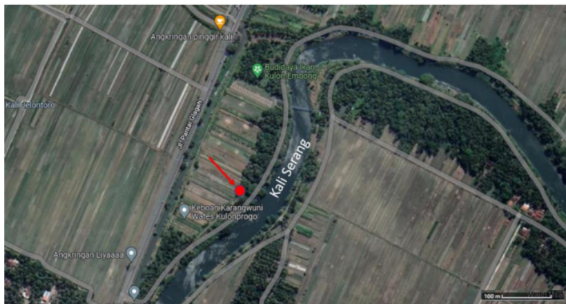
Gambar 2. Lokasi pengambilan sampel endapan