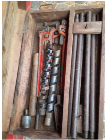
Gambar 1. Auger bor yang dipergunakan untuk mengambil sampel endapan

Sampel endapan yang dianalisis dengan XRD diambil pada kedalaman 4 meter dengan melakukan pemoran dangkal. Alat yang dipergunakan adalah auger bor (Gambar 1). Tujuan pengambilan sampel pada kedalaman 4 meter adalah agar sampel representatif dan tidak terpengaruh oleh faktor eksternal, misalnya tercampur dengan endapan permukaan. Lokasi pengambilan sampel berada pada koordinat E: 0399368 N: 9126166 (Gambar 2).