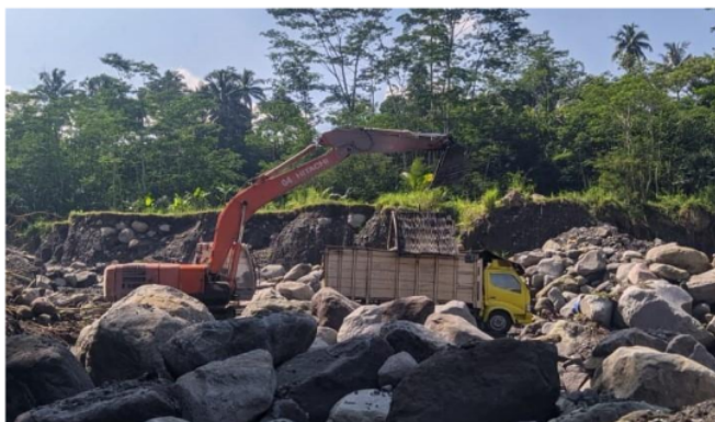
Gambar 4. Situasi penambangan area 2 (model menggunakan alat berat)