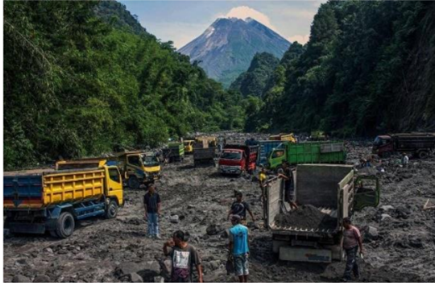
Gambar 3. Situasi penambangan area 1 (model tradisional)

sehingga antrian truk lebih banyak. Rata-rata perhari dari area ini bisa muat 16 truk (dipengaruhi oleh banyaknya permintaan dan kemampuan produksi/muat dari pekerja). Biaya tenaga muat untuk 1 truk sebesar Rp. 400.000.