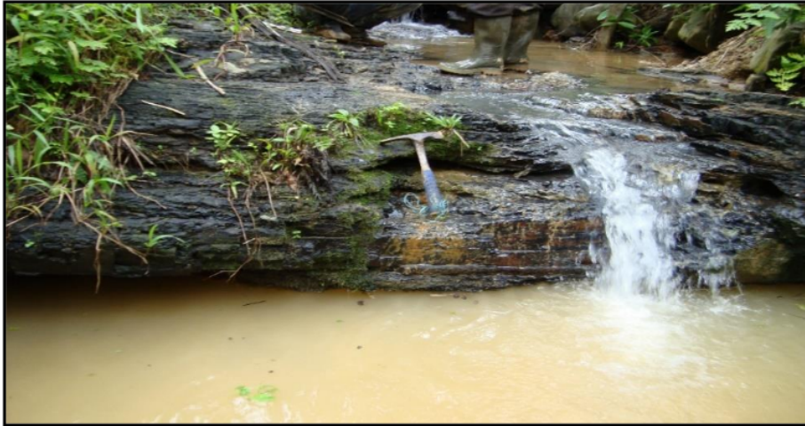
Gambar 3. Seam A2 batubara di Desa Tanjung Belit.