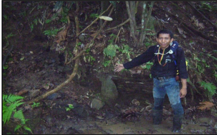
Gambar 5. Seam B2 batubara di Desa Tanjung Belit.

Pengamatan singkapan seam B2 yang dilakukan pada singkapan batubara, berada di bagian barat laut pada daerah telitian, singkapan berada tebing, lapisan batubara pada lokasi pengamatan ini mempunyai kedudukan lapisan batuan N 300°E/11°. Batubara, batuan sedimen organik, hitam, kilap cerah, gores: coklat kehitaman, brittle, pecahan: kotak tidak beraturan. Dan tebal 1.04 m. Lapisan bagian atas batubara (roof) dan lapisan bagian bawah batubara (floor). Lapisan bagian atas batubara (roof) berupa batulempung berwarna abu-abu, dengan ketebalan lebih dari 0.6 m (meter) dan Lapisan bagian bawah batubara (floor) berupa batu lempung karbon, berwarna hitam, dengan ketebalan lebih dari 0.53 m (meter).