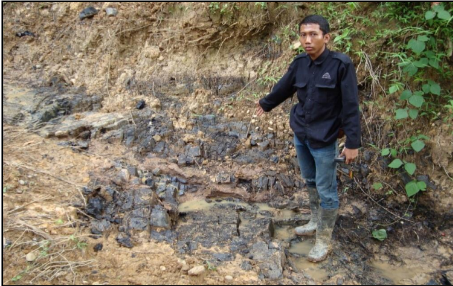
Gambar 4. Seam B1 batubara di Desa Tanjung Belit.

Singkapan seam B1 berada di bagian tengara pada daerah telitian, singkapan berada tubuh sungai, lapisan batubara pada lokasi pengamatan ini mempunyai kedudukan lapisan batuan N 305^{\circ}E/15^{\circ} . Batubara, batuan sedimen organik, hitam, kilap cerah, gores: coklat kehitaman, brittle, pecahan: kotak tidak beraturan. Dan tebal 1.7 m. Lapisan bagian atas batubara ( roof ) dan lapisan bagian bawah batubara ( floor ). Lapisan bagian atas batubara ( roof ) berupa soil berwarna coklat, dengan ketebalan lebih dari 1 m (meter) dan Lapisan bagian bawah batubara ( floor ) berupa batu lempung karbon, berwarna hitam, dengan ketebalan lebih dari 0.75 m (meter).