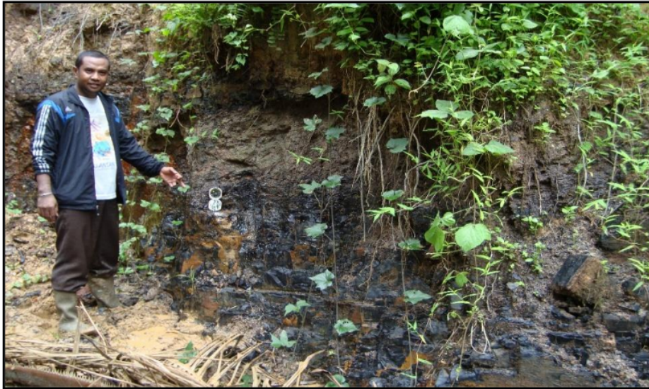
Gambar 2. Seam A1 batubara di Desa Tanjung Belit.

Pengamatan singkapan yang dilakukan pada singkapan batubara, berada di bagian barat laut pada daerah telitian, singkapan berada ditepi lereng bukit, lapisan batubara pada lokasi pengamatan ini mempunyai kedudukan seam A1 batuan N 315°E/12°. Batubara, batuan sedimen organik, hitam, kilap cerah, gores: kehitaman, brittle, pecahan: conoidal, terdapat amber. Dan tebal 1.8 m. Lapisan bagian atas batubara ( roof ) dan lapisan bagian bawah batubara ( floor ). Lapisan bagian atas batubara ( roof ) berupa batulempung berwarna coklat, dengan ketebalan lebih dari 0.8 m (meter) dan Lapisan bagian bawah batubara ( floor ) berupa batulempung berwarna coklat keabu-abuan, dengan ketebalan lebih dari 1,1 m (meter), jadi lapisan pengapit atau pembawa batubara yaitu batulempung.