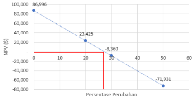
Gambar 3. Grafik Sensitivitas perubahan NPV berdasarkan perubahan biaya operasional

hingga proyek selesai ditahun ke tujuh akan lebih baik mendatangkan alat Doosan 340 DX LC5 baru dengan metode sewa.