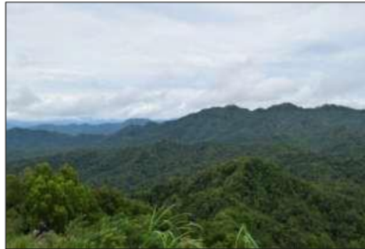
Gambar 3. Bentang alam G. Ijo dan sekitarnya, dicirikan relief kasar yang terdapat di dalam gawir yang melingkar (foto diambil dari puncak G. Ijo).

Bentang alam G. Ijo dan sekitarnya pada umumnya memperlihatkan relief kasar, dan melandai ke arah barat daya membentuk gawir terjal yang menghadap ke arah timur laut (Gambar 3). Gawir tersebut melingkupi bukit berbentuk kubah yang sedikit memanjang ke arah utara berupa tubuh intrusi, lava atau breksi autoklastika. Bentang alam ini merupakan bagian hulu atau daerah tangkapan air dari aliran – aliran sungai yang mengalir pada daerah penelitian yang akhirnya bermuara di Waduk Sermo atau Kokap. Pola pengaliran yang berkembang di satuan bentang alam ini adalah memusat pada bentuk cekungan waduk, sedangkan yang berkembang di belakang gawir yang melingkupi waduk berupa pola pengaliran relatif radier atau memancar menjauhi waduk. Waduk merupakan budaya manusia yaitu berupa bangunan dam atau bendungan untuk menampung air yang berasal dari banyak sungai berbagai arah dan menyatu di waduk tersebut.