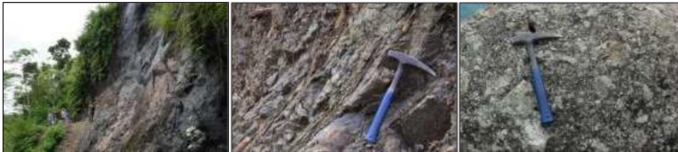
Gambar 5. Fasies pusat gunung api ditunjukkan oleh batuan intrusi diorit mikro sebagai cryptodome atau volcanic neck (kiri); lava andesit (tengah); dan aglomerat (kanan) (LP 6).

G. Ijo mempunyai bukaan (kawah) berdimensi sangat luas dengan diameter yang diperkirakan mencapai 2000 m. Bagian dalam bukaan G. Ijo tersebut disusun oleh litologi yang mempunyai kriteria batuan intrusi, cryptodome (intrusi dangkal yang terletak di bawah kubah lava), aliran lava yang membentuk struktur kekar lembaran, dan aglomerat (Gambar 5).