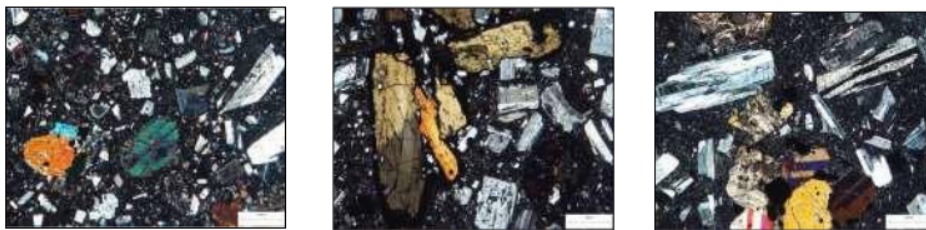
Gambar 4. Kenampakan petrografi batuan. Kiri: andesit – basal porfiri; tengah: andesit porfiri ; kanan: andesit piroksen.

Stratigrafi daerah penelitian tersusun oleh Formasi Sentolo, Kompleks Vulkanik Progo, endapan aluvial dan endapan produk G. Merapi. Secara umum, batuan gunung api yang dijumpai menunjukkan karakter batuan penyusun relatif seragam yang terdiri atas batuan beku dengan tekstur afanit – porfiroafanitik hipokristalin sampai bertekstur mikrokristalin. Batuan penyusun tersebut ekuivalen dengan batuan penyusun Formasi Andesit Tua yang diketahui sebagai kelompok batuan yang menerobos Formasi Nanggulan. Selain itu, tersingkap batuan karbonat yang mewakili Formasi Sentolo di bagian tenggara daerah penelitian.