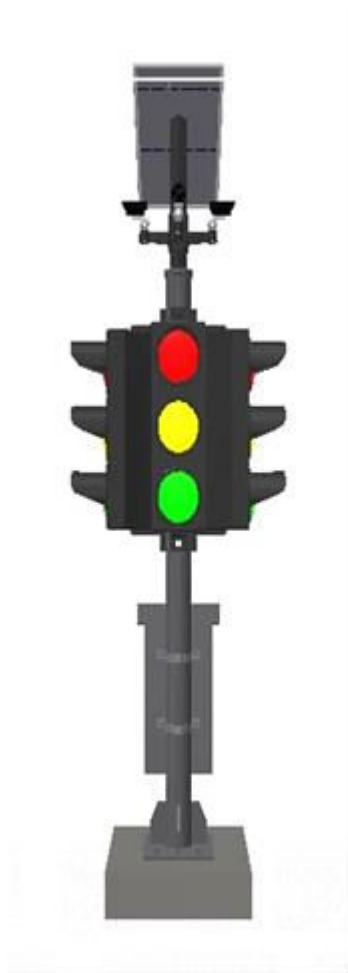
Gambar 2 : Tampak Belakang