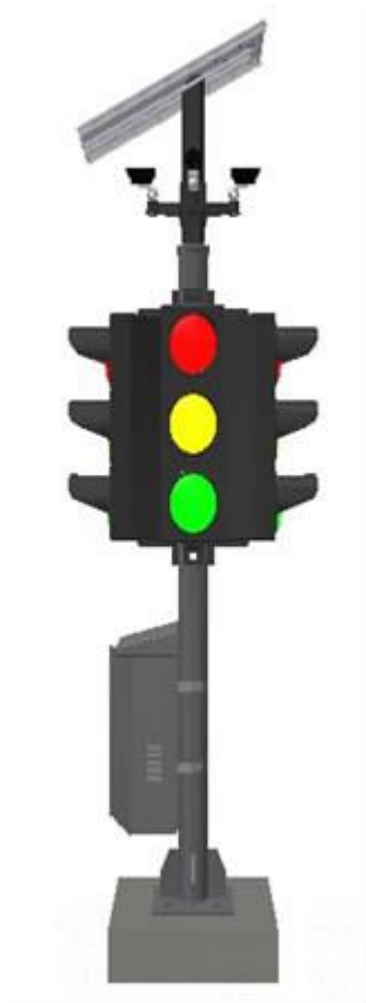
Gambar 4 : Tampak Samping Kiri