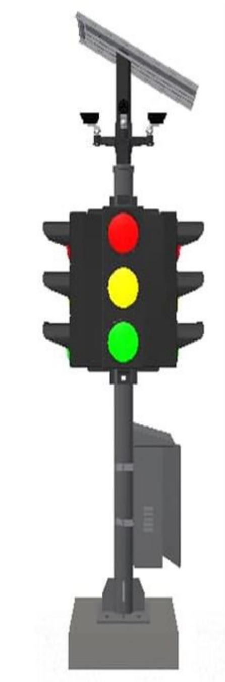
Gambar 3 : Tampak Samping Kanan