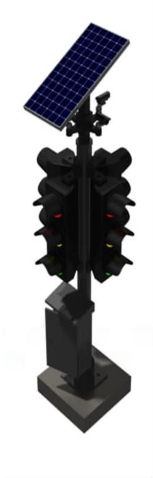
Gambar 6 : Perspektif