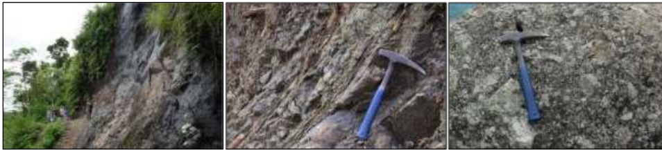
Gambar 5. Fasies pusat gunung api ditunjukkan oleh batuan intrusi diorit mikro sebagai cryptodome atau volcanic neck (kiri); lava andesit (tengah); dan aglomerat (kanan) (LP 6).

G. Ijo mempunyai bukaan (kawah) berdimensi sangat luas dengan diameter yang diperkirakan mencapai 2000 m. Bagian dalam bukaan G. Ijo tersebut disusun oleh litologi yang mempunyai kriteria batuan intrusi, cryptodome (intrusi dangkal yang terletak di bawah kubah lava), aliran lava yang membentuk struktur kekar lembaran, dan aglomerat (Gambar 5).