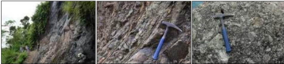
Gambar 5. Fasies pusat gunung api ditunjukkan oleh batuan intrusi diorit mikro sebagai cryptodome atau volcanic neck (kiri); lava andesit (tengah); dan aglomerat (kanan) (LP 6).

G. Ijo mempunyai bukaan (kawah) berdimensi sangat luas dengan diameter yang diperkirakan mencapai 2000 m. Bagian dalam bukaan G. Ijo tersebut disusun oleh litologi yang mempunyai kriteria batuan intrusi, cryptodome (intrusi dangkal yang terletak di bawah kubah lava), aliran lava yang membentuk struktur kekar lembaran, dan aglomerat (Gambar 5).