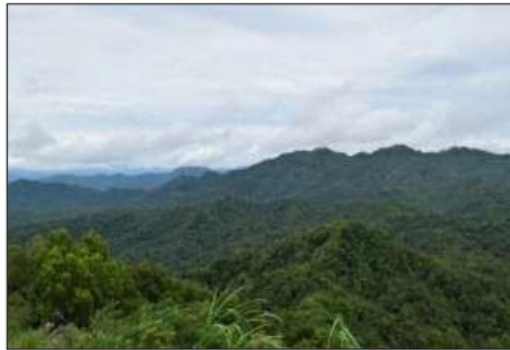
Gambar 3. Bentang alam G. Ijo dan sekitarnya, dicirikan relief kasar yang terdapat di dalam gawir yang melingkar (foto diambil dari puncak G. Ijo).

Bentang alam G. Ijo dan sekitarnya pada umumnya memperlihatkan relief kasar, dan melandai ke arah barat daya membentuk gawir terjal yang menghadap ke arah timur laut (Gambar 3). Gawir tersebut melingkupi bukit berbentuk kubah yang sedikit memanjang ke arah utara berupa tubuh intrusi, lava atau breksi autoklastika. Bentang alam ini merupakan bagian hulu atau daerah tangkapan air dari aliran – aliran sungai yang mengalir pada daerah penelitian yang akhirnya bermuara di Waduk Sermo atau Kokap. Pola pengaliran yang berkembang di satuan bentang alam ini adalah memusat pada bentuk cekungan waduk, sedangkan yang berkembang di belakang gawir yang melingkupi waduk berupa pola pengaliran relatif radier atau memancar menjauhi waduk. Waduk merupakan budaya manusia yaitu berupa bangunan dam atau bendungan untuk menampung air yang berasal dari banyak sungai berbagai arah dan menyatu di waduk tersebut.