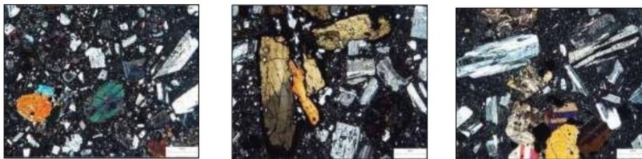
Gambar 4. Kenampakan petrografi batuan. Kiri: andesit – basal porfiri; tengah: andesit porfiri ; kanan: andesit piroksen.

Stratigrafi daerah penelitian tersusun oleh Formasi Sentolo, Kompleks Vulkanik Progo, endapan aluvial dan endapan produk G. Merapi. Secara umum, batuan gunung api yang dijumpai menunjukkan karakter batuan penyusun relatif seragam yang terdiri atas batuan beku dengan tekstur afanit – porfiroafanitik hipokristalin sampai bertekstur mikrokristalin. Batuan penyusun tersebut ekuivalen dengan batuan penyusun Formasi Andesit Tua yang diketahui sebagai kelompok batuan yang menerobos Formasi Nanggulan. Selain itu, tersingkap batuan karbonat yang mewakili Formasi Sentolo di bagian tenggara daerah penelitian.